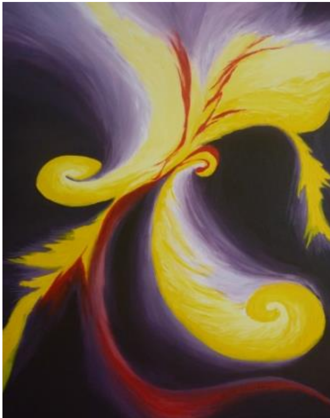
„Blume II“, 2014 Acryl auf Leinwand 60x80 cm