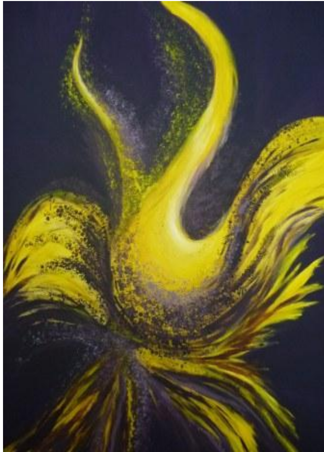
„Vogel VII“, 2017 Acryl auf Leinwand 90x150 cm